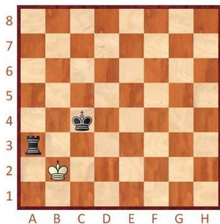
Černý na tahu