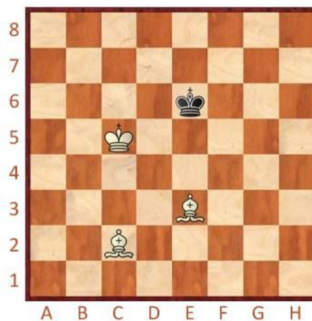
Bílý na tahu