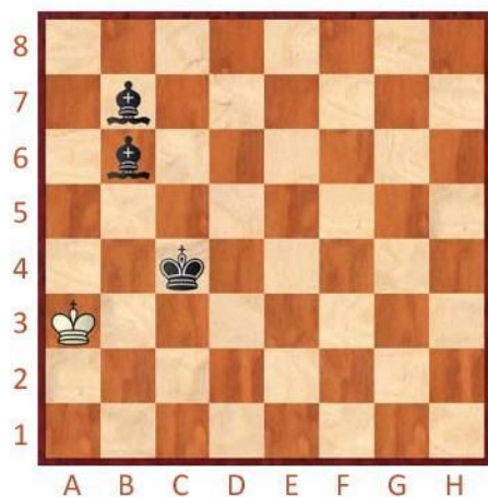
Černý na tahu