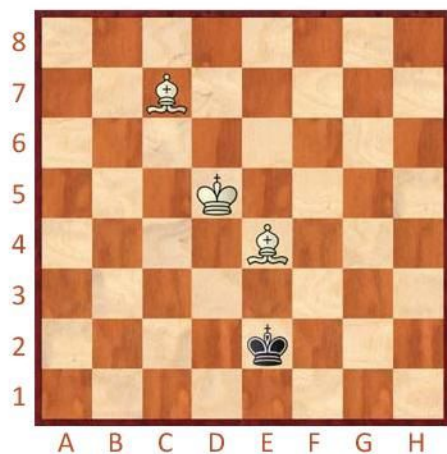
Bílý na tahu

Vyznačte a napište, jakým tahem byste v těchto pozicích pokračovali. Pozorná spolupráce krále a dvou střelců dokáže zázraky!