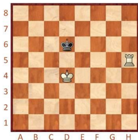
Bílý na tahu

Vyznačte a napište, jakým tahem byste v těchto pozicích pokračovali. Při matování králem a věží je důležité dát šach až ve správnou chvíli!