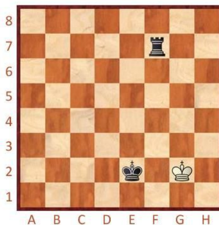
Černý na tahu