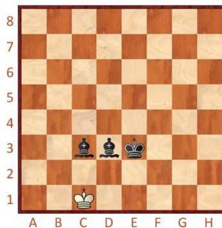
Černý na tahu