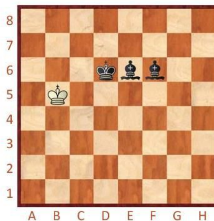
Černý na tahu