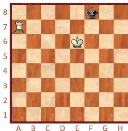
Bílý na tahu