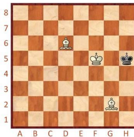
Bílý na tahu