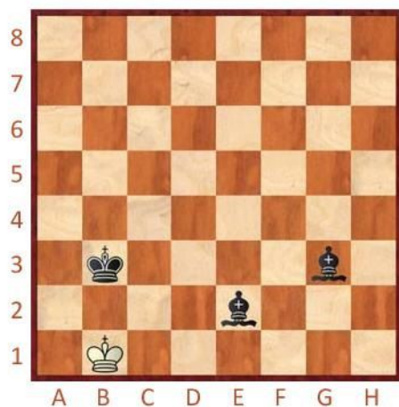
Černý na tahu