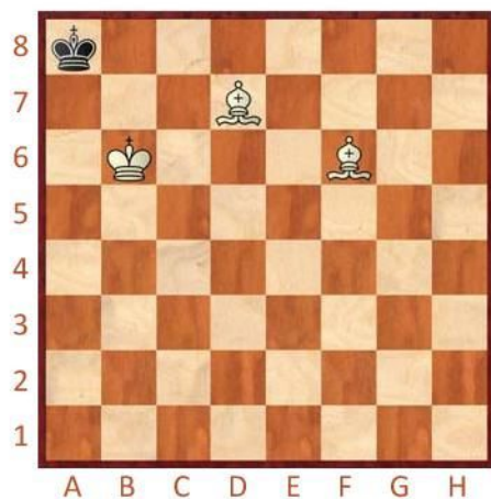
Bílý na tahu

Vyznačte a napište, jakým tahem byste v těchto pozicích pokračovali. Střelci si dávají pozor, aby krále nepustili na svobodu ani nedali pat.