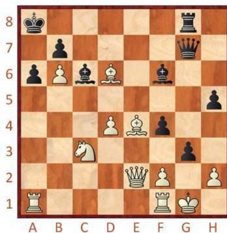
Černý na tahu