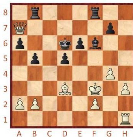
Černý na tahu