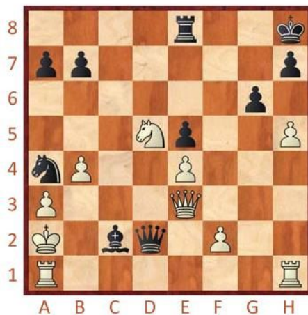
Černý na tahu