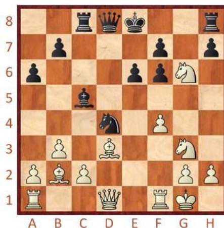
Černý na tahu