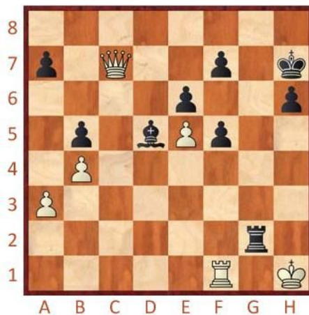
Černý na tahu