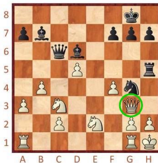
Černý na tahu