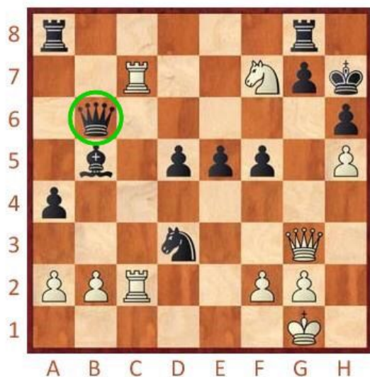
Bílý na tahu