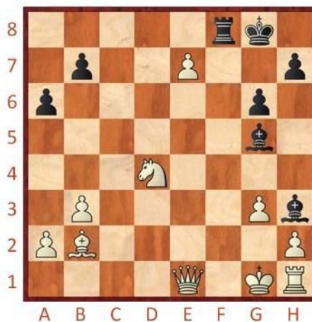
Černý na tahu