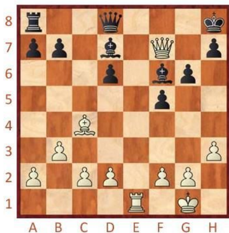
Bílý na tahu