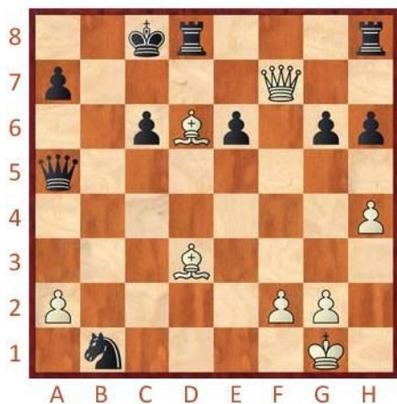
Bílý na tahu