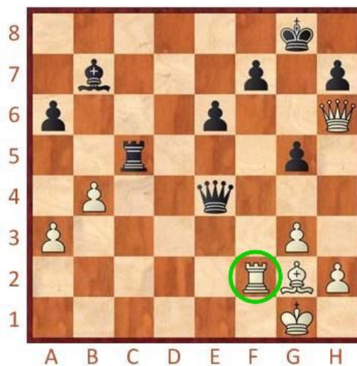
Černý na tahu