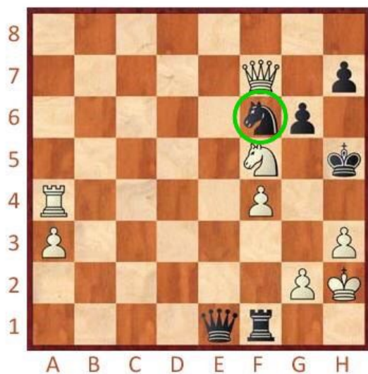
Bílý na tahu

Na každém diagramu zakroužkujte figuru, která nám brání dát mat. Při útoku obránce překryjeme, odlákáme či odstraníme!