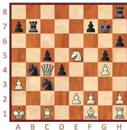
Černý na tahu