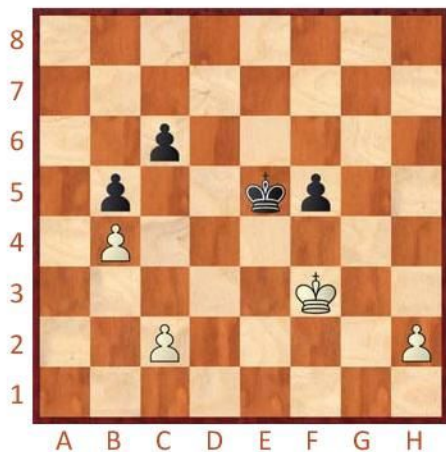
Bílý na tahu

Pod každý diagram napište, co byste zahráli a jak partie dopadne. Uděláme soupeři vzdáleného smutného krále a pak snadno zvítězíme.