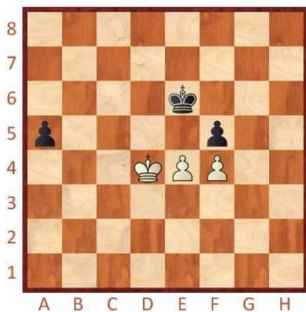
Bílý na tahu