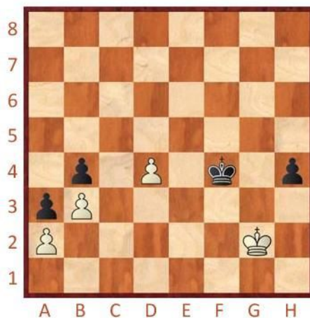
Černý na tahu