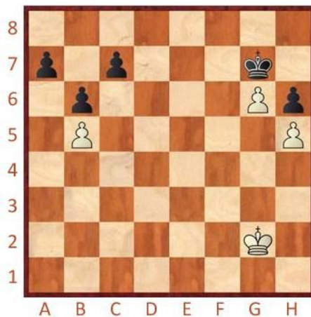
Bílý na tahu