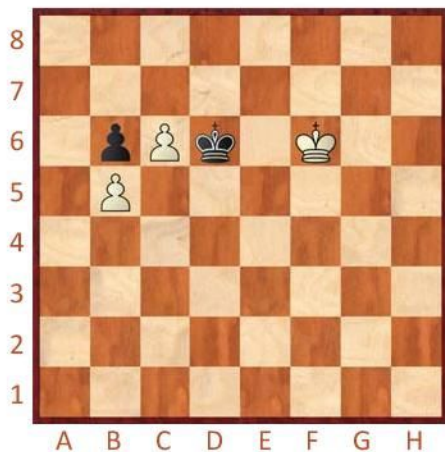
Bílý na tahu

Pod každý diagram napište, co byste zahráli a jak partie dopadne. Někdy můžeme krytého volného pěšce výhodně obětovat.