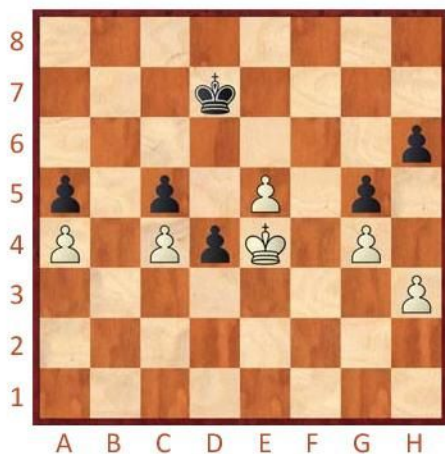
Černý na tahu