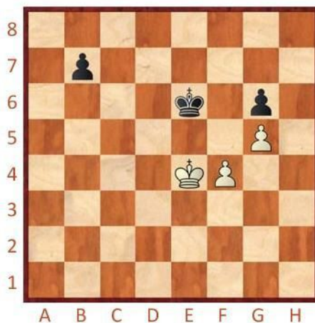
Černý na tahu