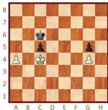
Bílý na tahu