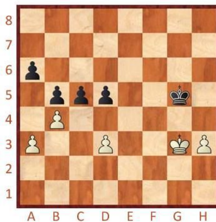
Černý na tahu